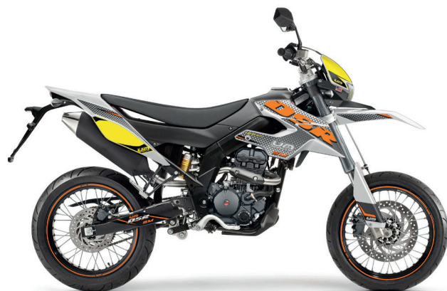
Wit - Grijs - Oranje