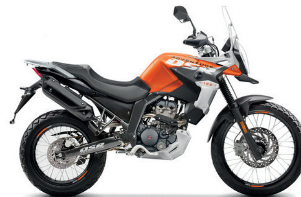
Zwart - Oranje