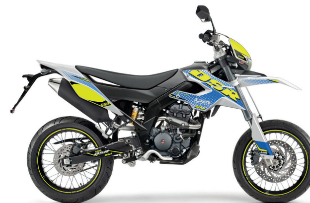
Wit - Blauw - Geel