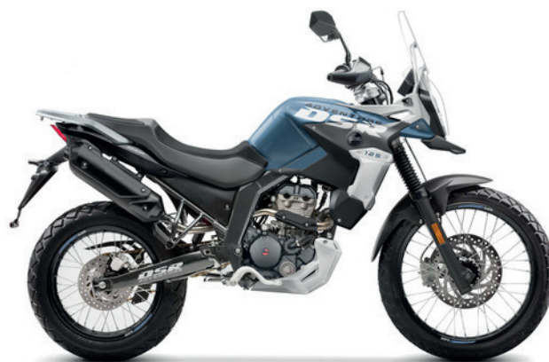
Zwart - Blauw