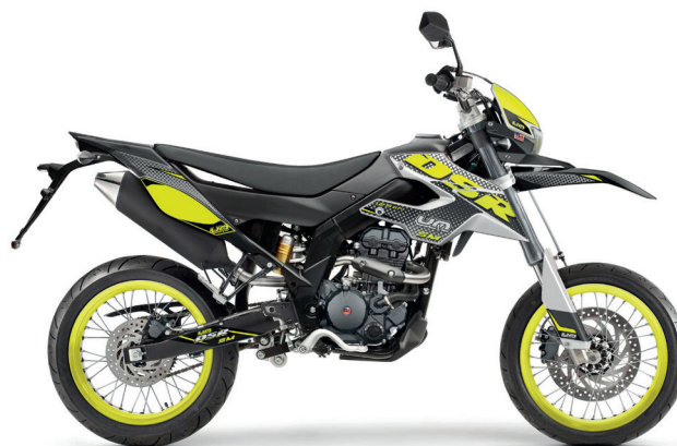
Wit - Zwart - Geel