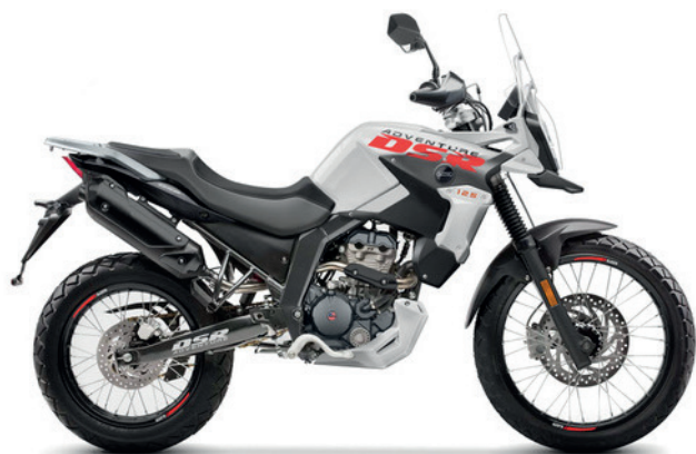
Zwart - Zilver